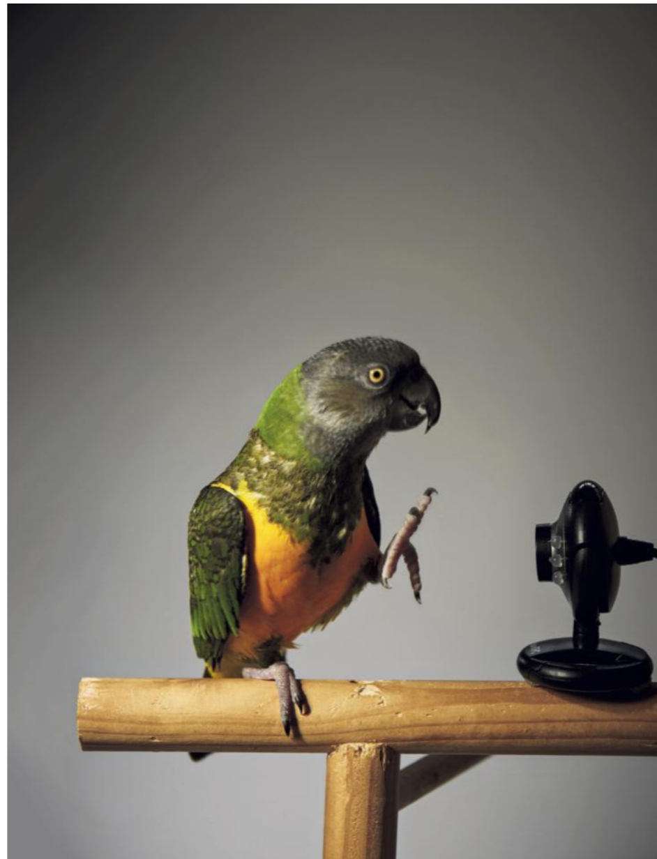
Tommy en Dusty zitten als hun baasjes op vakantie zijn de hele tijd aan elkaar te plukken.

Sinds 2013, na de zedenzaak rond Robert M., geldt op crèches het vierogenprincipe: een tweede volwassene moet altijd kunnen meekijken. Een extra reden voor camera's, zeggen crèches die ze aanbieden. Maar er schuilt ook een gevaar in: ze kunnen worden gehackt. Een 16-jarige jongen lukte dat in 2012 binnen een halfuur bij het camerasysteem van een crèche in Sliedrecht. Kinderactiviteitencentrum Ambersia in Almere huurde daarom een ethisch hacker in - het lukte hem niet in te breken. 't Molentje vertelt eerlijk tegen ouders dat dit risico bestaat, zegt Latenko. „We hebben verrasend genoeg geen klachten gehad.”